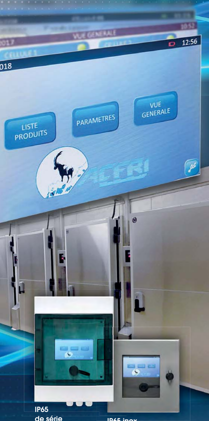
IP65 de série